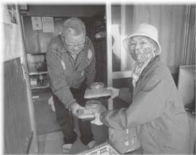
給食サービス事業