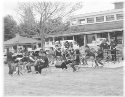
中札内中学校吹奏楽部