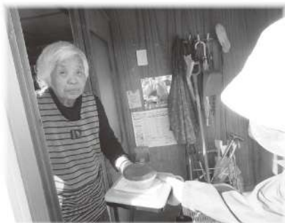
配食サービス事業

社協では、食事作りが困難な高齢者世帯、障害をお持ちの方へ配食サービスを行っております。