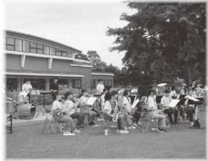
中札内中学校吹奏楽部